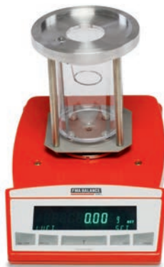
Waage (Basisgerät) Balance (base unit)