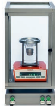
Waage + vibrationsgeschütztes und robustes Gehäuse Balance + vibration protected and robust housing