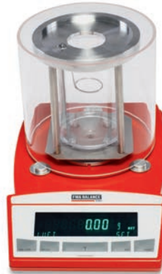
Waage + Windschutz (Plexiglas) Balance + wind protection (plexiglass)